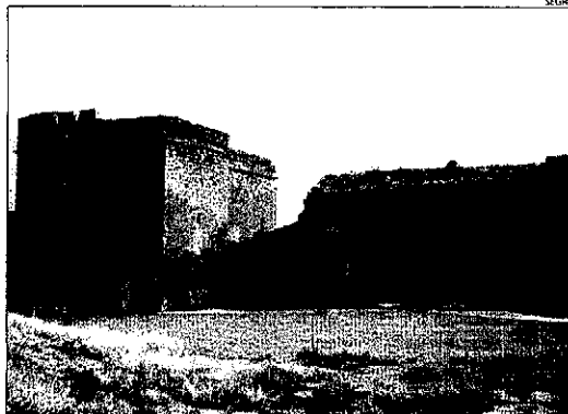
El restaurant s'ubicarà al costat del Castell dels Templers de Gardeny.

LLEIDA | El projecte es va adjudicar al juny del 2006 i, finalment, després de tres anys d'espera, va aconseguir llicència a principis de l'estiu passat. L'empresa adjudicatària, Templis Gardeny, preveia poder començar-ne les obres al setembre, però encara no ha pogut fer-ho. L'únic escull que queda per desbloquejar és la connexió de les xarxes de serveis. Falta per connectar l'electricitat i el clavegueram a la zona i l'ajuntament s'ha compromès a fer-ho. Ara, segons van explicar fonts municipals, estudien quina és la millor via per fer-ho, ja que l'obra, en especial la de clavegueram, és complicada. Els promotors del projecte podrien començar-ne ben aviat els treballs, ja que tenen totes les lli-