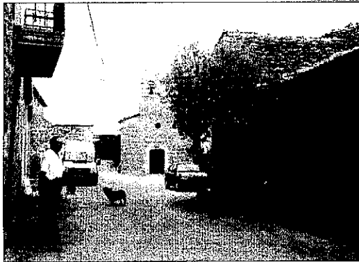
El petit nucli de Muller, als Plans de Sió.