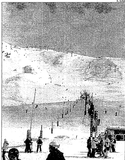
Imatge d'arxiu de Tavascan, que tanca diumenge.