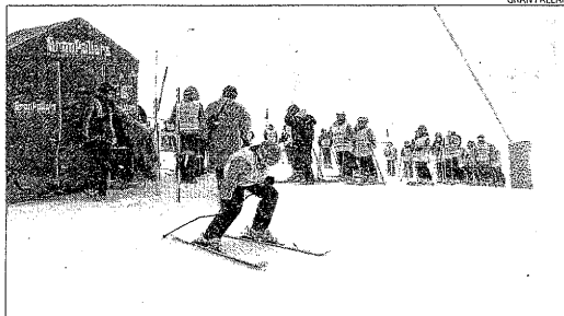
La Tamarro Race, en una de les passades edicions.

Per la seua part, Port del Comte, al Solsonès, també té com a meta el 3 d'abril. "Aguantarem fins a aquesta data i a partir de llavors veurem si podem continuar, en funció de les tem-