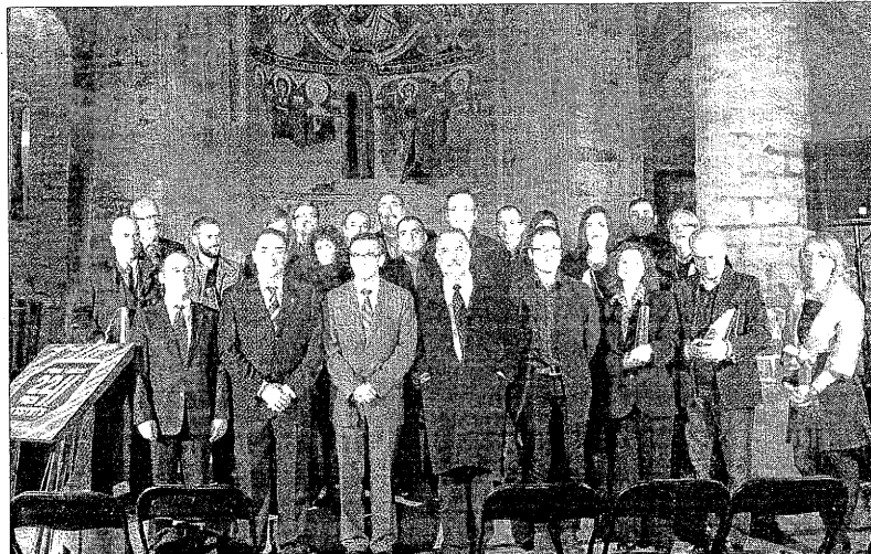
Imatge de grup de tots els premiats en aquesta edició dels premis Pica d'Estats.

Pedra de tartera , una producció del TNC i El Cellar d'Espectacles de Lleida, va començar ahir la gira catalana a la Llotja amb un gran èxit de públic. Una de les actrius fins i tot va demanar silenci als joves per poder treballar.