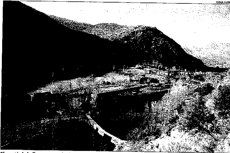
El pantà de la Torrassa, molt visitat ara per turistes i pescadors.