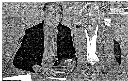
Florejacs homenajeará al poeta Jordi Pàmias FLOREJACS * La feria de Florejacs homenajeará el próximo 2 de abril al poeta Jordi Pàmias con el galardón La Flor de Florejacs.