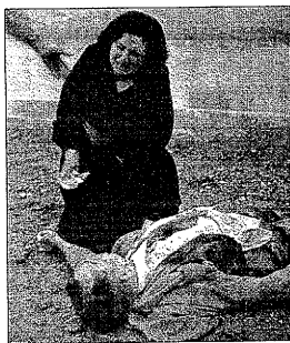
La imagen de Agustí Centelles

que ilustra el contexto en el que Picasso hizo su obra antifranquista, el Guernica , y otra obra menos conocida que es el centro de ésta exposición, titulada Sueño y mentira de Franco . La obra muestra la intensa actividad productiva que durante los años del conflicto llevó a cabo un grupo heterodoxo de artistas y comparte buena parte de los recursos gráficos y visuales sobre el impacto emocional.