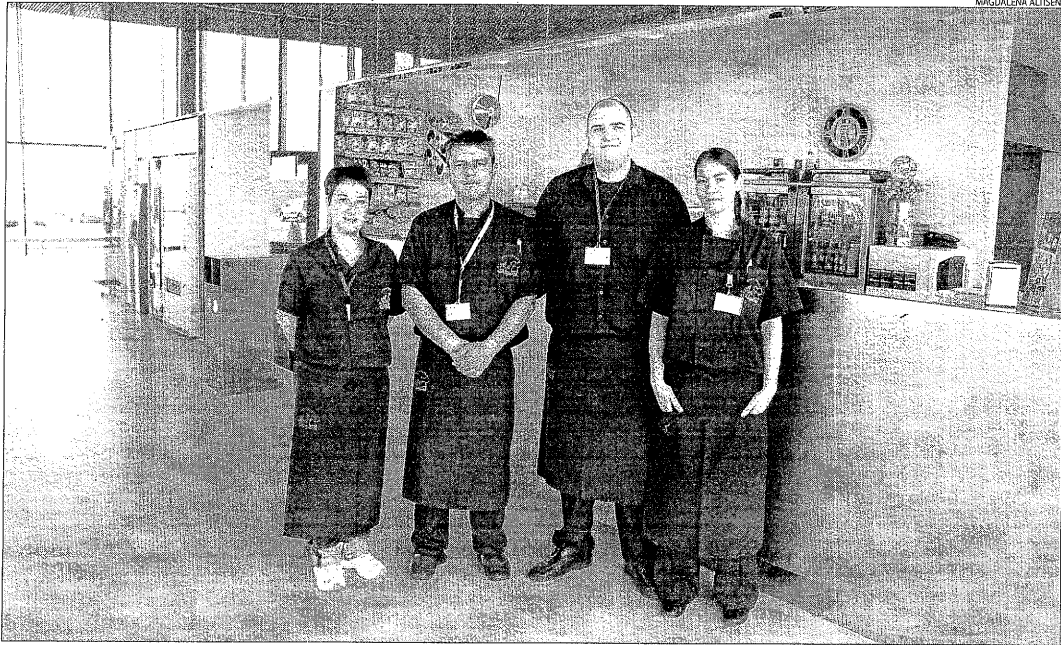
El nombre de clients del servei de cafeteria i restaurant de la terminal (a la imatge, responsable i empleats) ha baixat aquests mesos.

Actualment, l'empresa té quatre persones a jornada completa i dos a temps parcial. "Mirem de mantindre la plantilla, a l'espera de veure com va Air Nostrum i què passarà a l'anar-se'n Ryanair", va assenyalar. "Si la situació no millora, haurem de reduir el personal a la meitat", va dir. Malgrat tot, va apuntar que seguiran a l'aeroport, "cal esperar que els polítics es posin d'acord per impulsar-lo".