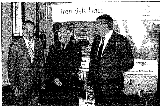
Un momento de la presentación de ayer en la Poble de Segur