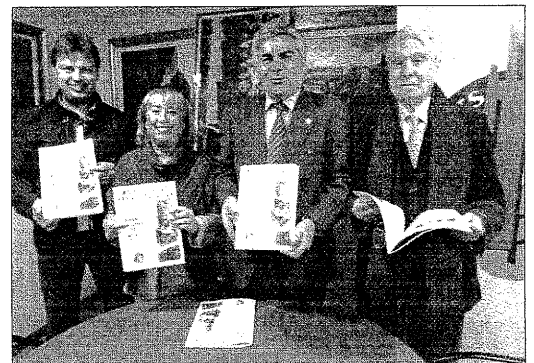
Un momento de la presentación de la revista sobre la fiesta anual