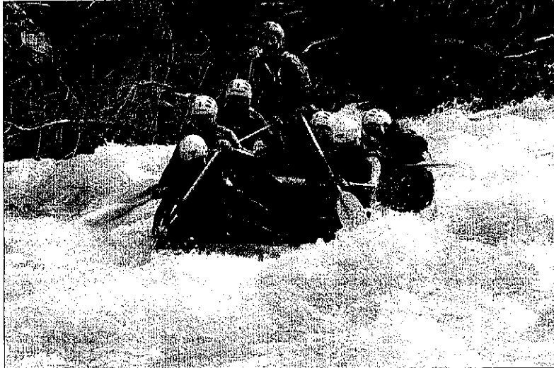
El bon temps va acompanyar els turistes que van optar per fer ràfting a la Noguera Pallaresa.

D'altra banda, la Diputació ha publicat les bases de la segona convocatòria de la xarxa Pobles amb Encant, de la qual ja formen part 20 localitats de menys de 1.000 habitants. Els interessats tenen de termini fins a l'abril per presentar-li les seues sol·licituds.