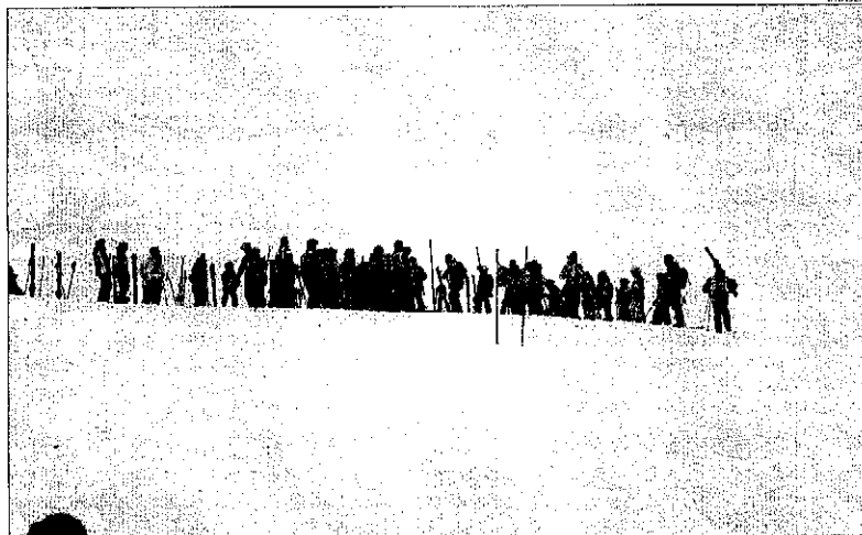
El Club d'Esquí de la vall de Cardós va celebrar ahir una cursa d'esquí per a nens a Tavascan.