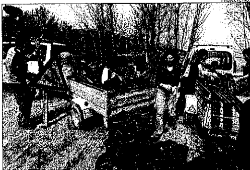
Els voluntaris de Tremp amb la brossa que van treure de Terradets.

[LLEIDA] L'eix que unirà per autovia Lleida, Osca i Pamplona estarà operatiu entre el 2014 i el 2015, segons el secretari d'Estat d'Infraestructures, Víctor Morlán.