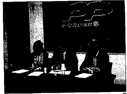
El diputado del PP Tomás Burgos visitó ayer Lleida

Los motivos de entrada de estos vehículos al depósito, (16 turismos y dos motocicletas) son, principalmente, tres: el abandono (5 turismos), la falta de documentación (el más abundante, 9 turismos y dos motocicletas), y la infracción (dos de los 18 vehículos). El importe para retirar estos vehículos era de 114,85 euros en el caso de los turismos y de 7,74 euros en el caso de las motocicletas. Su trámite como residuo sólido urbano se ha debido en todos los casos a que se ha renunciado al vehículo y al pago del importe.