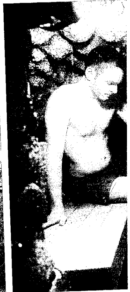
Un client del balneari de Caldes de Boi, durant un c