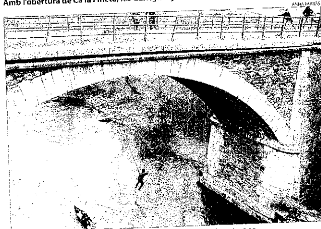
Salt de pont i piragüisme a la Noguera Pallaresa aquesta setmana.