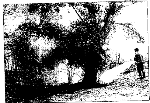
Incendi ahir a la tarda prop de l'embarcador de la Mitjana.