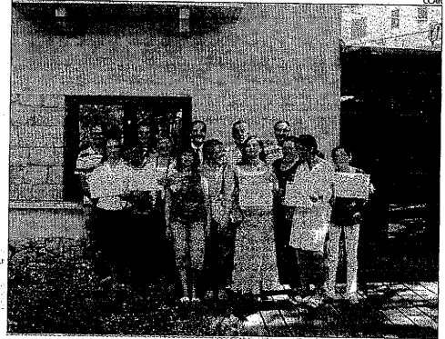
Els assistents al curs de formació de fa dos anys.