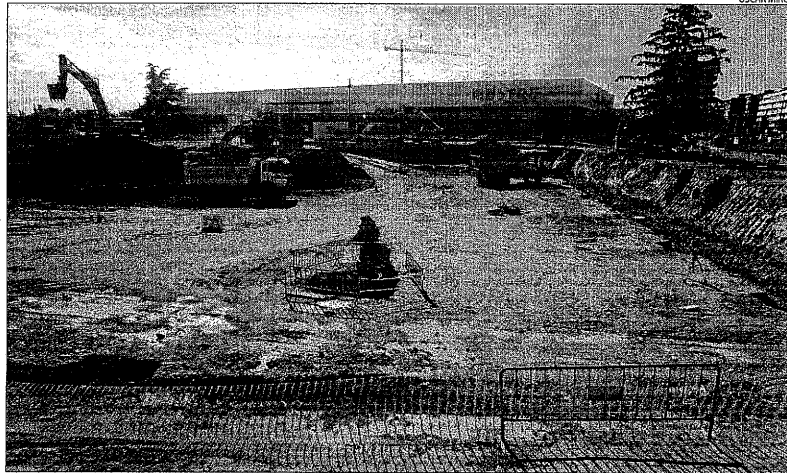
L'excavació del solar on es construirà un establiment comercial de la cadena Decathlon.

Els promotors del projecte tenen un any per començar les obres dels nous equipaments hotelers i tres anys per finalitzar-les, encara que és possible sol·licitar pròrrogues. En tot cas, la caducitat de la llicència es produirà si se supera algun dels dos terminis.