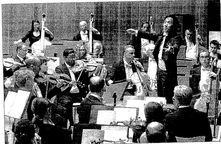
El japonès Eiji Oue dirigeix amb entusiasme l'Orquestra Simfònica de Barcelona i Nacional de Catalunya.