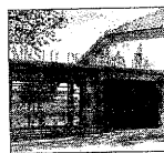
El Museu de l'Aigua de Lleida.

Exposició 'Algües del món, un món d'algües'. Campament de La Canadiense. De dimarts a diumenge, d'11.00 a 14.00 hores. Gratuït.