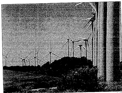
Un parque eólico de la demarcación de Lleida