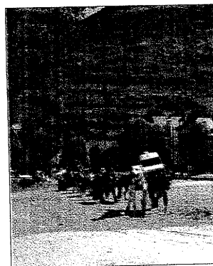
► Vielha celebra en las calles el Dia

Informa-te'n Universitat de Lleida C/Universitat de Lleida, 1 Edifici Pradell 08100 Lleida, Catalunya