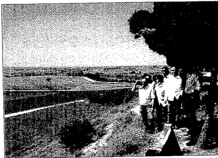
Tremosa, Alòs y Batalla, en la ZEPA Belianes-Preixana

Por una parte, el eurodiputado explicó que "si en un futuro los mapas ornitológicos cambian -que es lo que desea