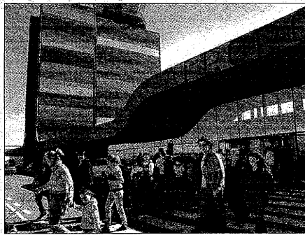
El aeropuerto de Alguaire ampliará en breve sus destinos

El esquiador portugués acostumbra a desplazarse a los Pirineos, mayoritariamente, en temporada baja, de ahí que la compañía no prevea los dos enlaces con Portugal desde el inicio de la próxima campaña de nieve y opte por iniciar estos vuelos más tarde, cuando suelen viajar los turistas lusitanos.