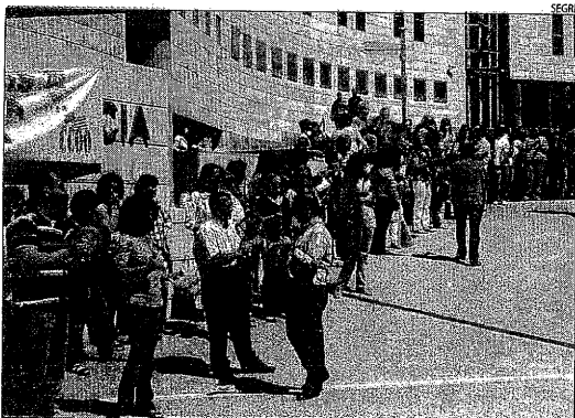
Casserolada al Canyeret ■ Un total de 70 funcionaris de l'administració de justícia de Lleida van participar ahir en una nova casserolada en protesta per la retallada salarial.

Per la seua part, el grup municipal de CiU del Vendrell, com va publicar aquest diari, té la intenció de seguir els passos de Lleida i presentar en el pròxim ple una moció que demani la prohibició del vel islàmic integral en equipaments municipals.