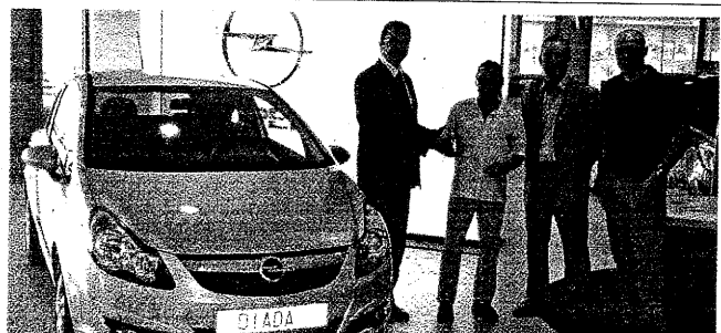
NIT DE L'HOSTELERIA, entrega de les claus de l'Opel Corsa al guanyador. A l'acte assistiren representants de la Federació d'Hosteleria, Lleidamòbil i San Miguel.

de las personas que necesitan tan atención sociosanitaria desde una perspectiva global, tanto con respect a intervenciones preventivas como las curativas o de rehabilitación. La configuración y contenidos de la ludoteca móvil para personas mayores ha sido diseñada con la colaboración del Institut Tecnològic de la Juguina.