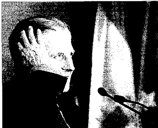
El president del Banc Central Europeu (BCE), Jean-Claude Trichet.

El secretari d'Estat d'Hisenda va explicar que la meitat de la desviació en el pressupost inicial recaptador es deu a la despesa en mesures econòmiques del Govern per cobrir l'assegurament de la desocupació