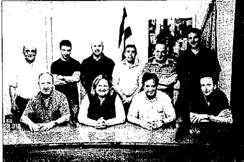
Representants dels municipis que han creat la iniciativa.

La seu de l'associació es troba a Torà i dimarts es van firmar els primers documents. A més, es va decidir dissenyar un logotip i una pàgina web. En el