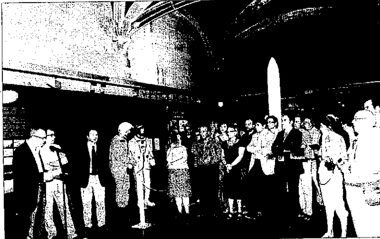
Un moment de la inauguració de l'exposició sobre els cent anys de vols a Lleida.