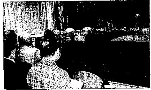
Moment de la conferència sobre l'acadèmia a Tremp.