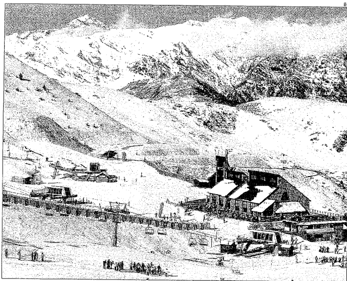
L'estació de Boí-Taüll, on ahir ja es van registrar nevades i on s'acumulen entre 60 i 170 centímetres de gruix.

D'altra banda, el fred que es manté, encara que menys intens que en dies passats, permet posar en funcionament els canons d'innivació artificial per deixar els complexos en bones condicions. A la cota 2.500 es van registrar 5 graus sota zero a l'estació de l'Alta Ribagorça.