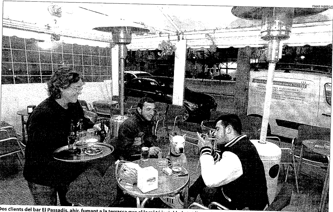
Dois clients del bar El Passadís, ahir, fumant a la terrassa que el local té instal·lada tot l'any a Pardinyes.

D'altra banda, el departament de Salut va assegurar ahir que el 83% dels locals inspeccionats (1.165 a les comarques de Lleida) compleixen la nova llei antitabac, que, segons les seues estimacions, evitarà 800 morts cada any per tabaquisme passiu.