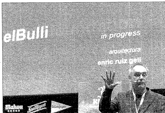
Ferran Adrià presentó su nuevo proyecto en el certamen Madrid Fusión