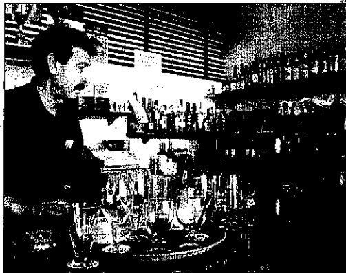
Un dels locals de Pardinyes afectats per l'apagada d'ahir.

El titular d'un establiment a la rambla de Pardinyes (Corregidor Escofet) va explicar que, per sort, havien acabat de preparar menús quan se'n va anar la llum, de manera que van poder servir dinars, però els comensals es van quedar sense