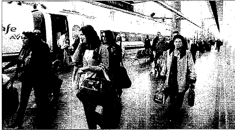
Imatge d'arxiu de viatgers de l'AVE baixant d'un tren procedent de Madrid.

En canvi, en l'altre sentit, de Madrid a Lleida, només registra canvis el primer tren del matí. Sortirà 5 minuts més tard (a les 05.50 en lloc de les 05.45) i escurça en 3 minuts el trajecte, que passa a durar 2 hores i 2 minuts, és a dir, el que seria l'AVE més ràpid entre les dos ciutats. En els trajectes a Saragossa i Barcelona, les diferències són mínimes, encara que hi ha algun ajust. Així mateix, el trajecte Lleida-Màlaga, que cobreix un tren al dia, s'escurça en 7 minuts, i el que va a Sevilla, en 5 en direcció a la capital andalusa i en només un cap a Lleida.