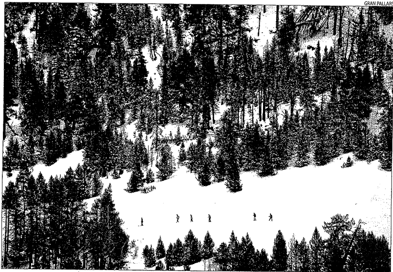
Un grup d'esquiadors descendent per una de les pistes d'Espot.

D'altra banda, els tècnics del Conselh d'Aran van ultimar ahir els controls antiallaus i el port de la Bonaigua va quedar definitivament obert.