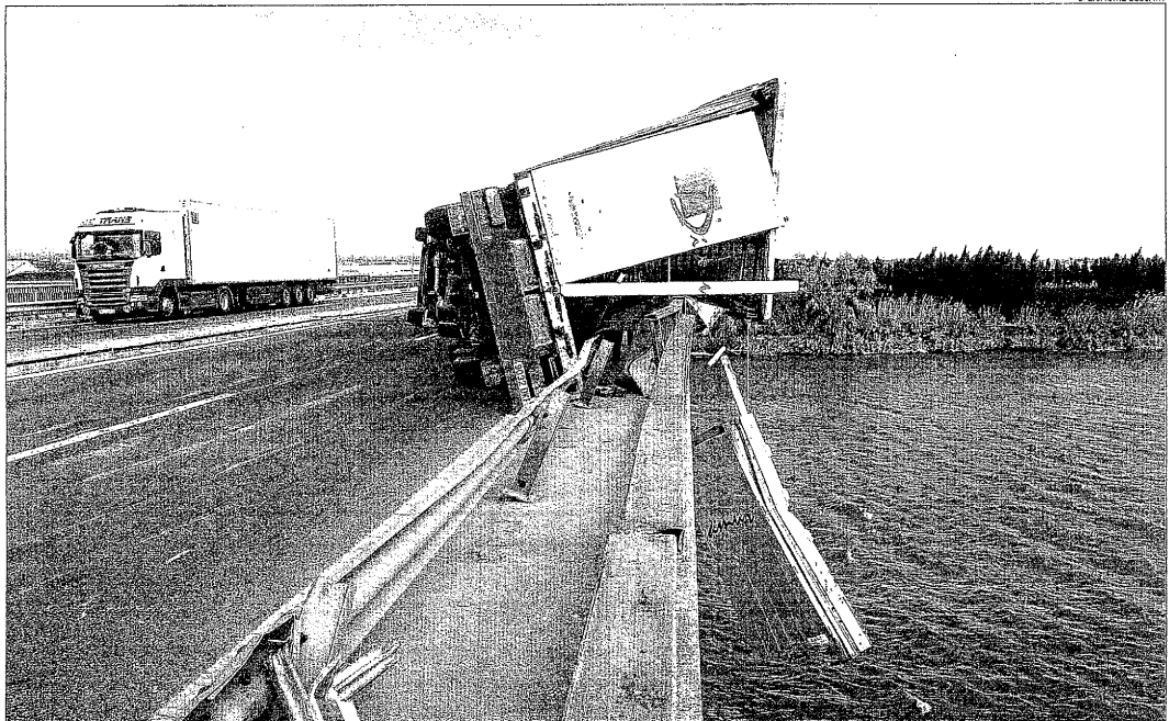
Un camió va bolcar ahir a causa del fort vent al pont sobre el riu Ebre, a la N-340, al seu pas per Amposta.

LLEIDA | Les fortes ràfegues de vent de component nord i oest que es van registrar ahir van causar greus problemes de circulació i van ocasionar desenes de petits desperfectes, especialment al matí i als extrems nord i sud de Catalunya. Al Pirineu lleidatà, les ratxes de més de cent quilòmetres per hora —a la cota 2.519 d'Espot es va arribar als 127,8 km/h— van obligar a tancar més de 50 pistes d'esquí. L'estació més afectada va ser la de Boí-Taüll, on només van poder obrir 12 de les 51 pistes. Espot va estar tancada durant tot el matí i no va ser fins a partir del migdia quan va poder obrir 17 pistes de les 22 esquiables, sempre per sota de la cota 2.000. Va passar el mateix a Port del Comte, que només va obrir la pista de debutants durant el matí, i Tavascan va obrir 4 pistes de 7, no només pel vent, sinó també per la neu, amb 40 centímetres acumulats en 24 hores, segons van apuntar els responsables de l'estació. Així mateix, la neu va causar problemes de circulació al port de la Bonaigua, on es necessitaven cadenes, així com a la carretera