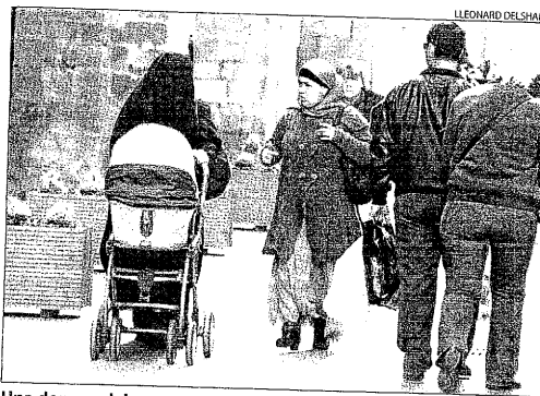
Una dona amb la cara completament tapada, dissabte a Lleida.