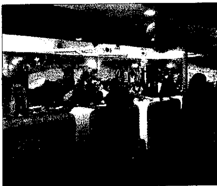
► Lleida, presente en la feria de turismo Navatur

■ Medi Ambient, el Ayuntamiento y el núcleo de Vilamitjana participan en este proyecto ambiental