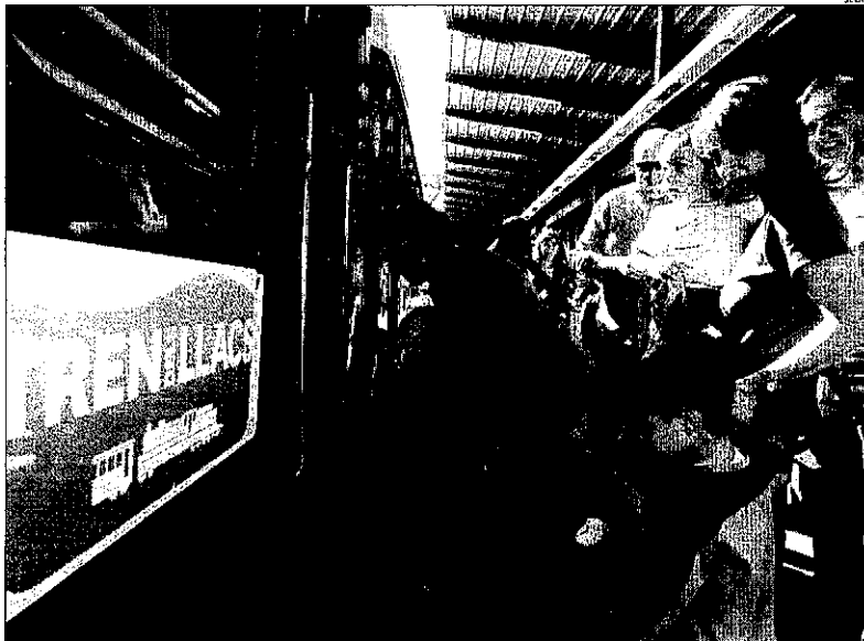
Imatge d'arxiu d'un dels trajectes del Tren dels Llacs.