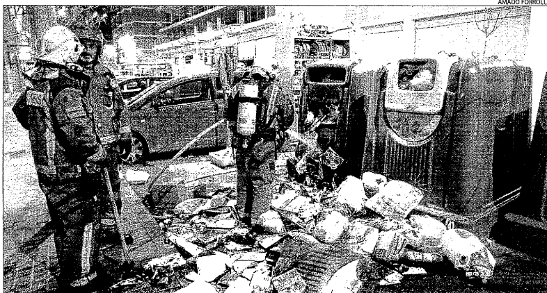
Els bombers, després de sufocar ahi a la nit l'incendi de contenidors al carrer Camí de Corbins.

A més, els bombers també van haver de treballar en incendis de vegetació a Nalec i a Bell-lloc d'Urgell.