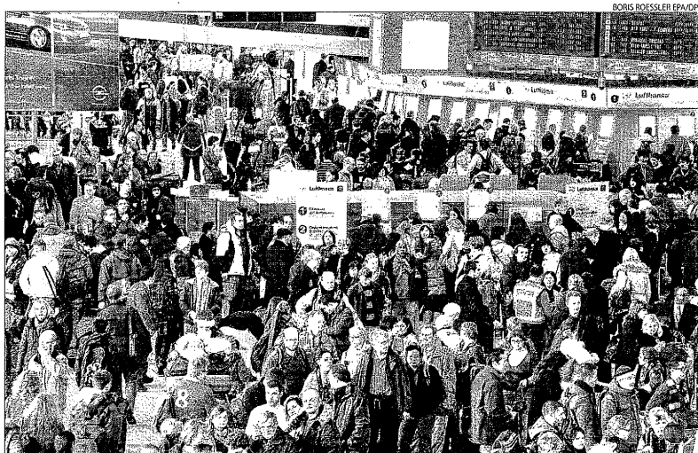
Milers de passatgers esperaven ahi a la terminal de sortides de l'aeroport de Frankfurt.

La neu i les baixes temperatures van obligar ahi a cancel·lar 168 vols amb les principals capitals europees en diversos aeroports espanyols. Al Prat de Barcelona es van anul·lar vint-i-sis vols que tenien com a origen i destinació aeroports britànics, alemanys i francesos. El mateix va passar als aeroports de