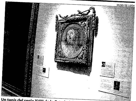
Un tapís del segle XVIII de la Catedral de Lleida salvat per Lamolla.

D'altra banda, el museu se suma a la celebració del centenari del pintor Antoni Garcia Lamolla per destacar la seua tasca de defensor del patrimoni. Per fer-ho, ha senyalitzat la trentena de peces de la seua exposició que l'artista es va encarregar de salvaguardar perquè no fossin destruïdes durant la Guerra Civil.