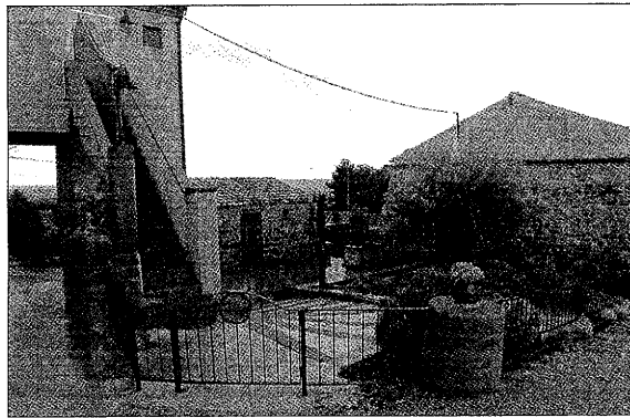
Establecimiento de turismo rural en la comarca de l'Urgell

En cuanto a la demarcación de Lleida copó más de la mitad de las casas rurales categorizadas en la primera tanda. De las 88 que recibieron alguna espiga en Catalunya, 53 fueron en la demarcación de Lleida. En concreto fueron, 2 con cuatro espigas, 14 con tres espigas, 26 con dos espigas y 11 con una espiga. Ni en Lleida ni en el resto de Catalunya hay, de momento, ningún establecimiento de turismo rural con la máxima categorización, que es de cinco espigas.