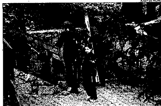
A l'esquerra, la infanta Elena amb els seus dos fills. A la dreta, la seua germana Cristina i la filla d'aquesta, baixant d'un telecàbina.