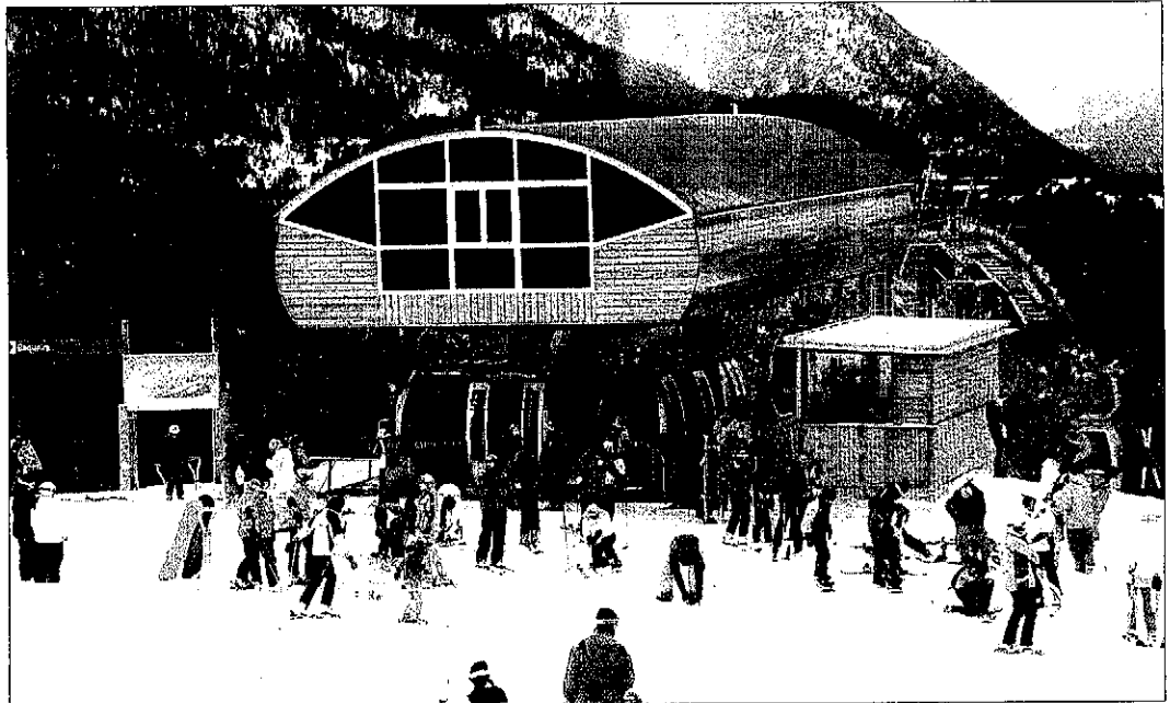
Alguns dels esquiadors que ahir van acudir a Baqueira, a les portes del telecàbina de Ruda.

D'altra banda, un despeniment de roques a la N-260 al seu pas per Arsèguel va obligar a donar-hi pas alternatiu als vehicles durant una hora, segons va explicar l'alcalde del municipi, Antoni Casanóva. La incidència es va registrar cap a les 21.00 hores. Així mateix, va ser necessari l'ús de cadenes per circular pel port de la Bonaigua (C-28) i a l'accés al pla de Beret (C-142-B) a partir de les 18.00 hores. La nevada que va caure a les cotes altes del Pirineu es va convertir en pluja al Prepirineu i al pla de Lleida.