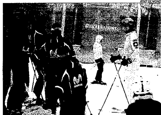
Els ducs de Palma, ahir a les pistes de Baqueira.