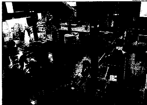
Sala principal de la discoteca Excess, que obre aquesta nit.

aquests delictes la resolució no només ha de ser il·legal "sinó arbitrària i dictada coneixent la seua injustícia". En aquest cas, assegura que "la infracció de la legalitat és si més no dubtosa" i mai seria "patent o evident", com exigeix la jurisprudència per a casos de prevariació. Per aquest motiu, desestima el cas per via penal, encara que queda oberta la del contenciós.