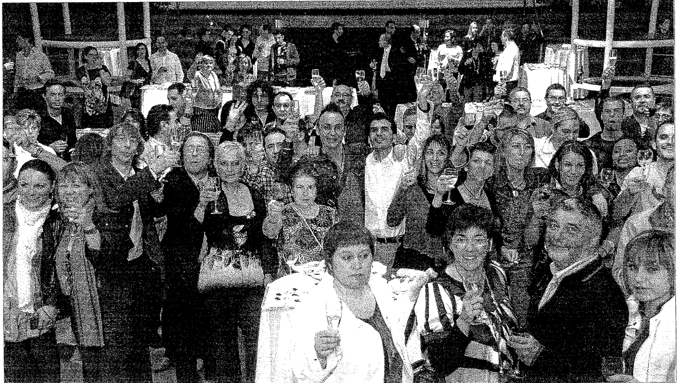
Més de 4.000 persones van celebrar a la discoteca Wonder el final de la diada amb un sopar preparat per restauradors lleidatans i una festa.