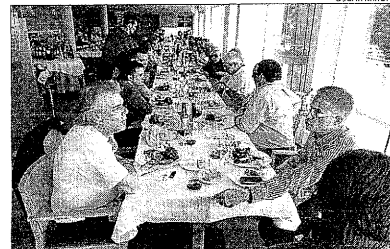
Hostalers durant el dinar de la Diada.