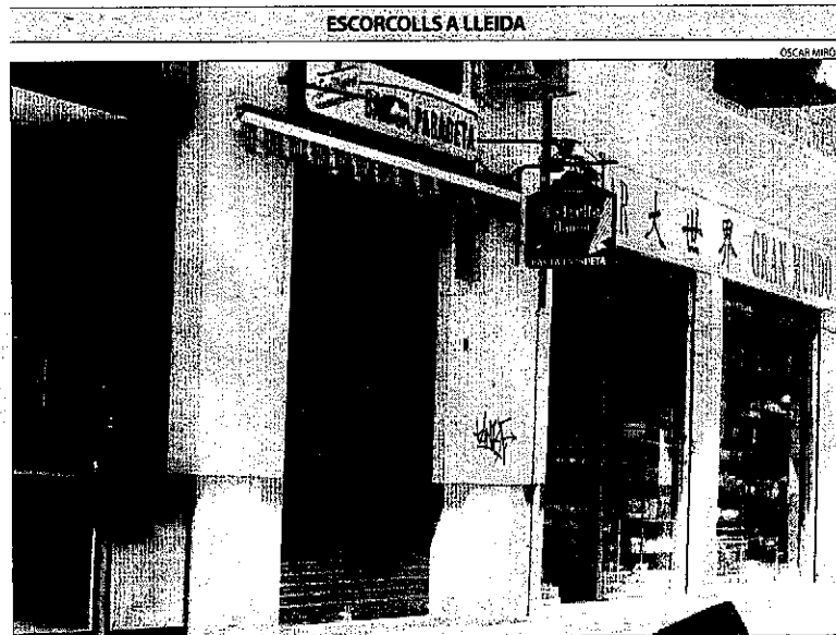
Els dos detinguts regenten el bar La Paradeta, a Pardinyes.

Fonts de la policia van afirmar que podrien portar-se a terme altres escorcolls d'aquest tipus a la ciutat de Lleida i que no es descarten més detencions. De moment, no ha transcendit si la banda clonava les targetes de crèdit als caixers automàtics d'entitats bancàries amb l'ajuda de microcàmeres o si utilitzava els dispositius de clonació o skimmer en establiments comercials, en el moment que els clients paguen amb targeta (vegeu el desglossament vertical). S'ha d'assenyalar que la policia tampoc va voler revelar la quantitat de targetes de crèdit o dèbit que podrien haver estat clonades a través d'aquest procediment ni la quantitat de diners que els delinqüents haurien aconseguit estafar.