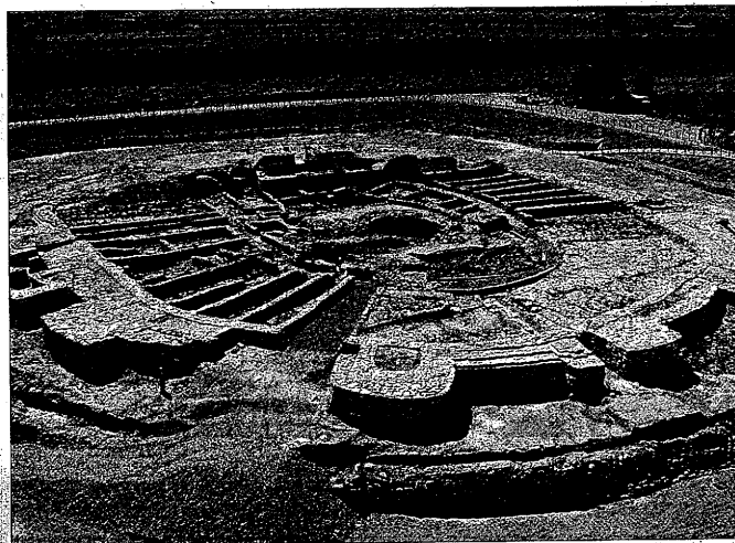
Els Vilars d'Arbeca ha de convertirse en uno de los grandes reclamos

Garrigues y también la parte baja del Segrià, denominada también como les Garrigues històriques. El objetivo final de toda la iniciativa es convertir el territorio de influencia de la DO Garrigues en el destino líder de Oliturisme de calidad a nivel nacional.