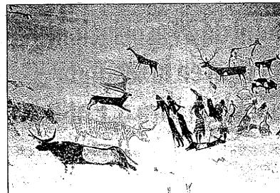
El Cogul tendrá un Centro de Interpretación

LES BORGES BLANQUES. El Parc Temàtic del Oli de les Borges Blanques lidera el ranking de visites de la comarca de les Garrigues, amb 41.975 visitants en l'any 2009, segons dades del Consell Comarcal. Le segueix la fortalesa de los Vilars con 4.800 visites y la sala d'exposicions de la Fira con 3.800 visites. Se destaca que las pinturas del Cogul han sido cerradas al público durante el 2009 por la construcción del Centro de Interpretación.