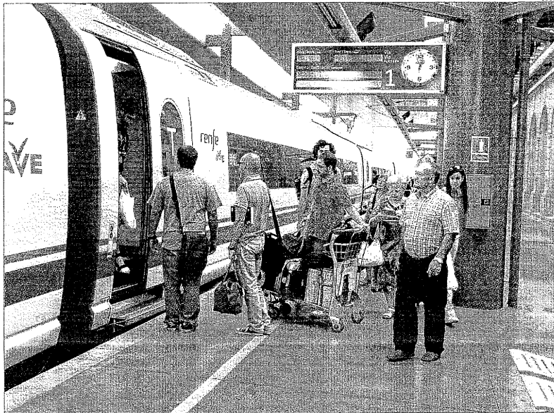
Imatge recent de viatgers pujant a un AVE a l'estació de Lleida-Pirineus.

El trajecte entre Madrid i Lleida només el cobreix actualment l'AVE i no hi ha cap alternativa més barata