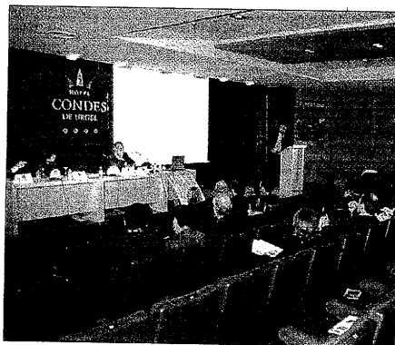
El hotel dispone de 4.000 metros cuadrados de salones

A pesar de que la empresa no ha detallado los puestos de trabajo que estarían afectados por el ERE, los representantes de los empleados ya se han reunido con éstos para intentar que el expediente elimine las mínimas ocupaciones posibles.