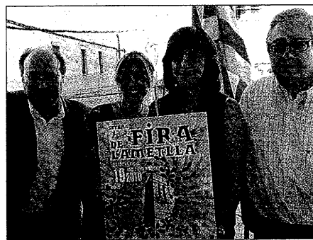
Los organizadores presentaron la Fira de l' Ametlla

"Se trata de un edificio catalogado en la nueva ordenación urbanista con cuyos propietarios estamos ultimando los últimos detalles para su compra", dijo el Alcalde. La creación de este equipamiento es una de las viejas aspiraciones de Vilagrassa como un elemento para la promoción de la localidad", añadió.