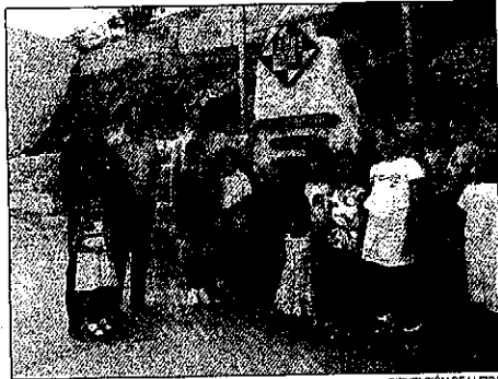
La placa conmemorativa se halla en la calle Sant Llorenç