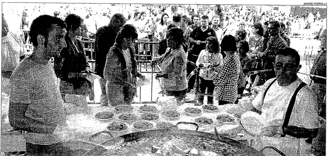
Unes 1.200 persones es van aplegar ahir al pati del col·legi d'Albatàrrec per degustar paella amb caragols i carn.

ALBATÀRREC | Unes 1.200 persones es van aplegar ahir al pati del col·legi d'Albatàrrec per degustar una paella amb caragols i carn en el marc de la festa major de la localitat. Tot i que, al principi, s'hi van registrar diverses cues per recollir la ració corresponent, a poc a poc la situació es va normalitzar. L'ajuntament espera que en la pròxima edició no es torni a repetir aquesta allau de persones. A la tarda hi va haver un espectacle infantil i activitats per als joves, així com una exhibició de freestyle . És el segon any que Albatàrrec organitza una paella popu-