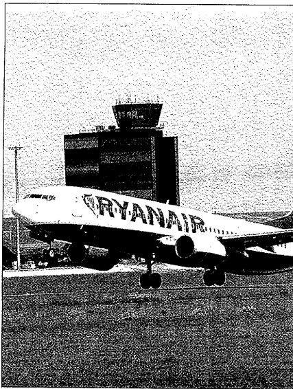
Alguaire tendrá poca actividad el 24 de diciembre

Algunos de estos vuelos también han anulado la conexión con Lleida el 31 de diciembre y el 7 de enero. No habrá vuelos de Vueling con conexión a Alicante, Bilbao, Bruselas, Lisboa y Venecia el último día del presente año 2010, ni a Alicante, Asturias, Bilbao, Bruselas, Granada y Lisboa el día después de la festividad de Reyes.