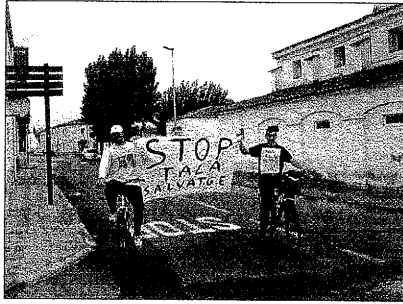
La protesta coincidió con una bicicletada popular