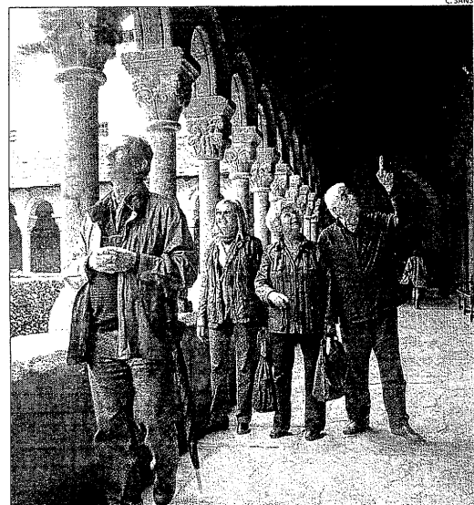
Turistes al claustre de la catedral de la Seu.