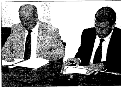
Boada y Boya firman el acuerdo de colaboración

El acuerdo conseguido entre los gobiernos aranés y catalán mejora la coordinación en el caso de emergencias y